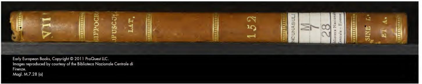
Magl. M.7.28 [a]